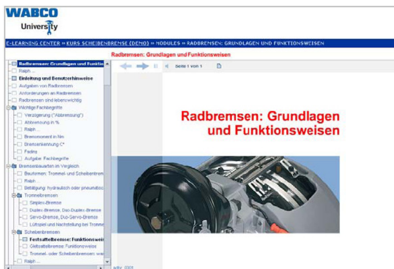
Obr. 1: E-Learning „kotoučové brzdy“

Nové online technické školení na internetu „kotoučové brzdy“ se týká moderních kolových brzd pro užitková vozidla. Hlavním tématem jsou přitom vzduchotlaké kotoučové brzdy konstrukční řady PAN od firmy WABCO.