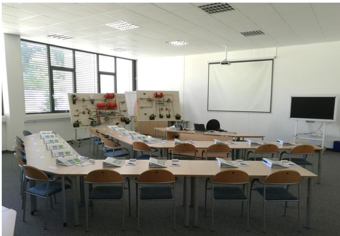
Moderní školící místnost s projekční technikou.