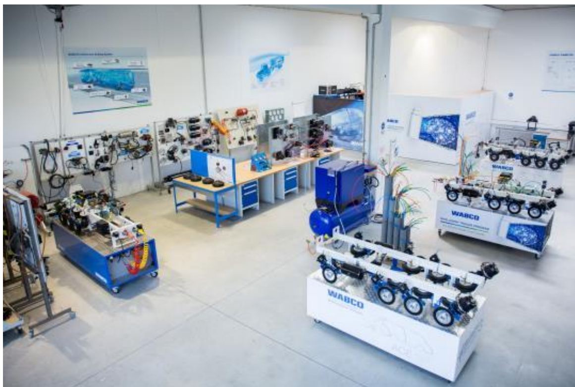
Funkční modely systémů WABCO pro praktickou výuku.